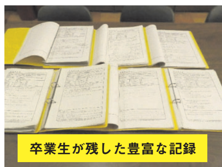
卒業生が残した豊富な記録

進路相談室は自習室として開放しており、生徒たちが朝早くから訪れて先生に質問したり、自習したりしています。本校は、自ら学ぼうとする生徒の意欲とそれを支える教員の情熱でいつも活気に溢れています。