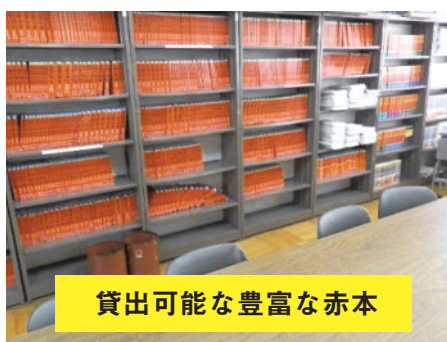
貸出可能な豊富な赤本