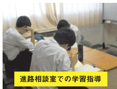
進路相談室での学習指導

春日井高校独自のデータベースを用い、個々の生徒の学力を分析した詳細な資料を提供しています。